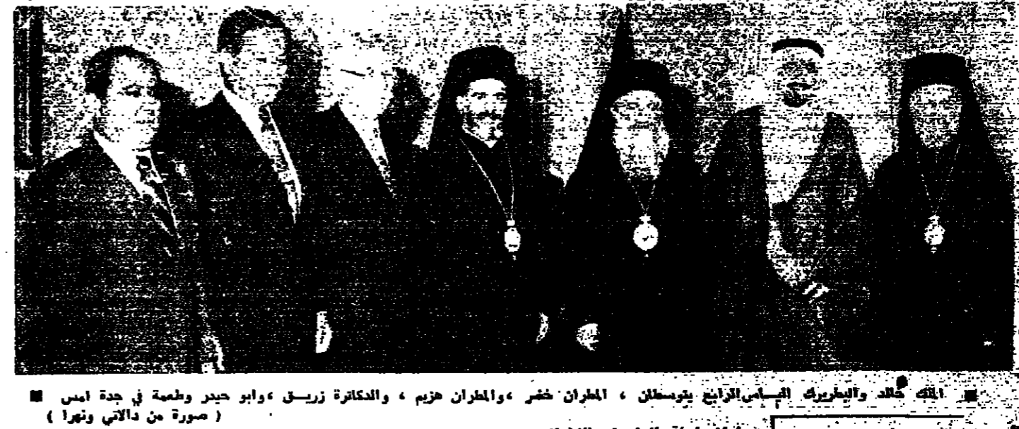
الملك خالد والبطريك الاسي الرابع يوسفان، المهران خضر، والمهران خريم، والكاتبة زريق، وابو حيدر وطعمة في جده امس